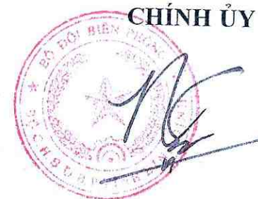
Đại tá Phan Trường Sơn